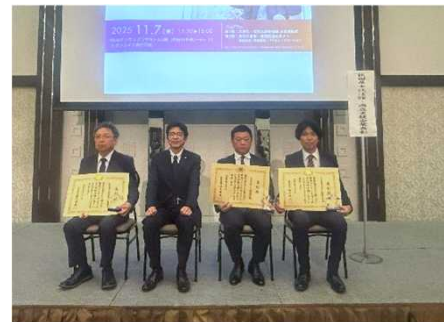
令和7年度表彰の様子