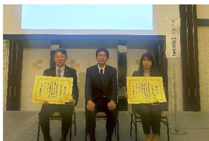
令和7年度表彰の様子